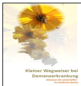
4. Ausgabe Juni 2021