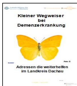
2. Ausgabe August 2016