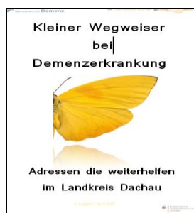
1. Ausgabe Juni 2015