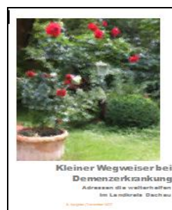
3. Ausgabe Dezember 2017